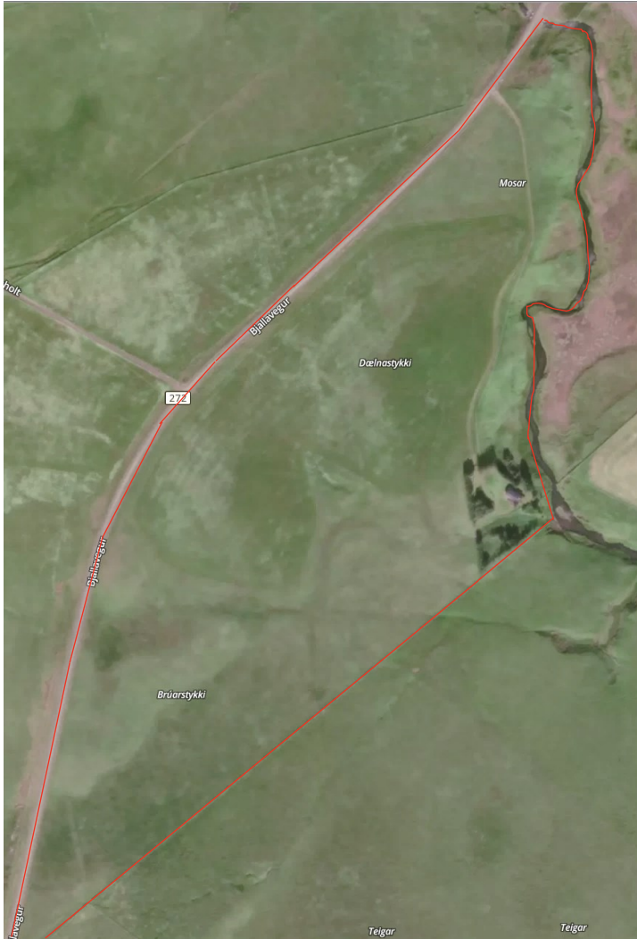
MYND 1. Skipulagssvæðið innan rauðu útlínanna.