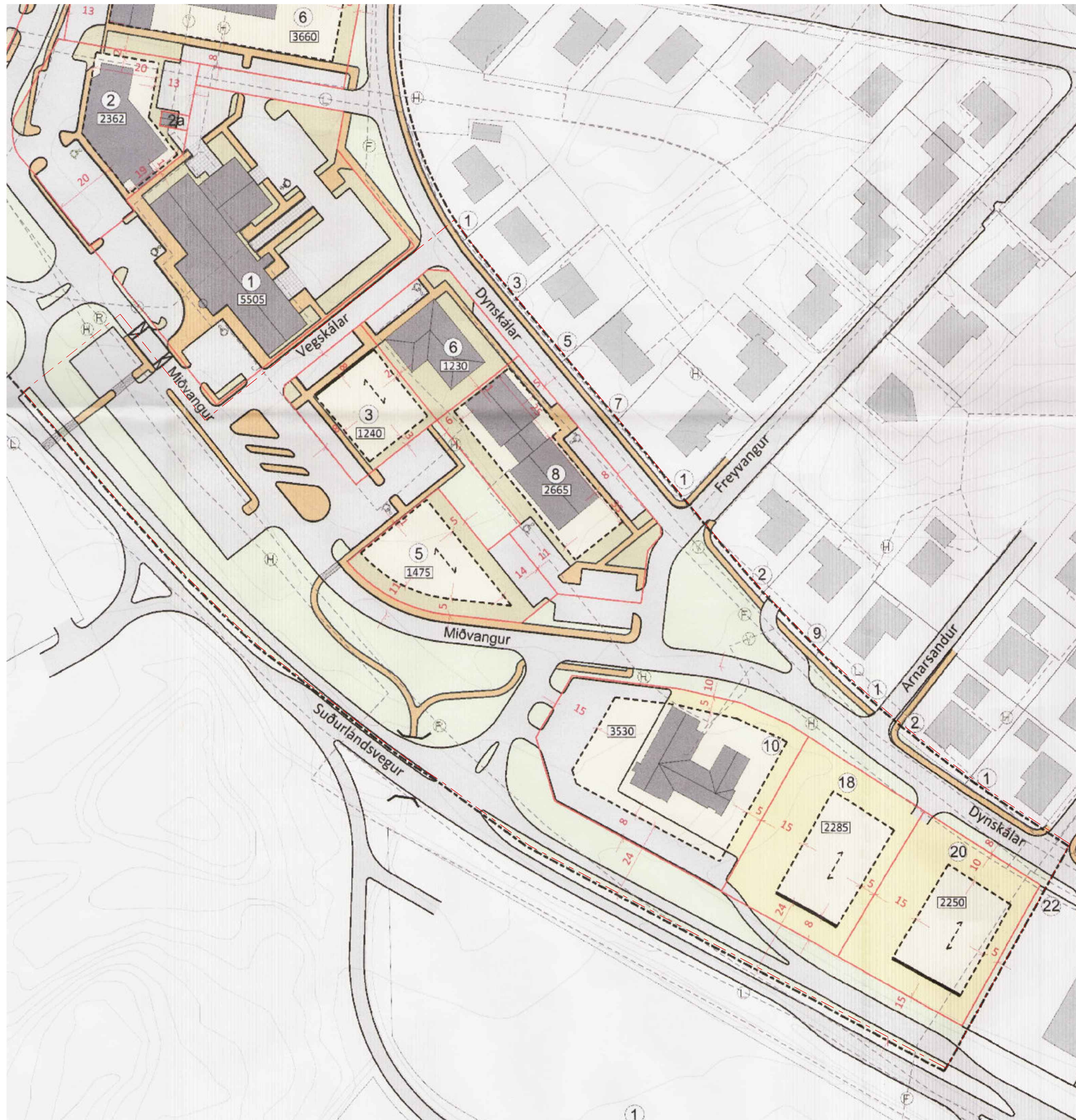
GILDANDI DEILISKIPULAG - HLUTI MINNKADUR Í MKV. 1:2000