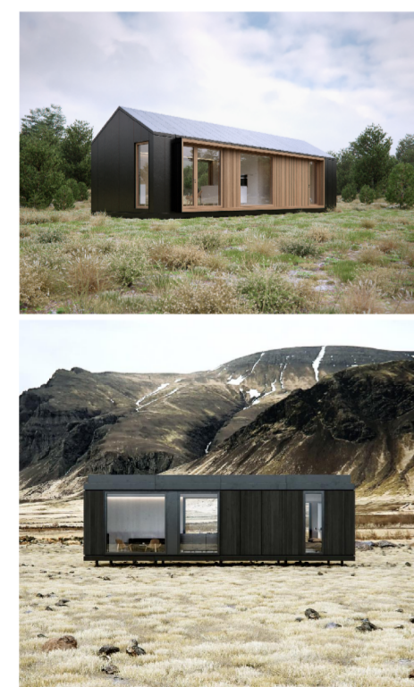
Tillaga að húsum