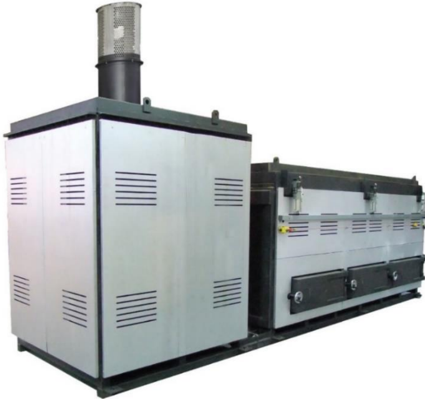
Mynd 2. Brennsluofn af gerðinni i8-1000A

Brennsluofninn er 6,54 m á lengd, 1,84 m á breidd og 5,37 m á hæð. Gert er ráð fyrir að ofninn komi til landsins fullbúinn á 40 feta (12,19 m) fleti sem verður boltaður niður á 74 m 2 plötu sem steipt verður á staðnum. Þar yfir verði síðan reist stálgrindarskýli. Tillaga framleiðanda að lágmarksstærð stálgrindarskýlis utan um ofninn er 6,3 m að breidd og 11,7 m á lengd. Í skýlinu verða lagnir fyrir rafmagn, heitt og kalt vatn, auk fráveitulagnar. Við skýlið verður settur upp olútankur sem uppfyllir öll skilyrði reglugerða um árekstrarvarnir og lekavarnir. Olía er notuð til að halda uppi hita í brennslunni og er gert ráð fyrir að olíunotkunin nemi u.þ.b. 50 l/klst. á þeim tímum sem brennsla er í gangi. Við skýlið verður einnig settur upp lokaður gámur til tímabundinnar geymslu á dýrahæjum sé ekki unnt að hefja brennslu um leið og þau berast. Gámurinn mun uppfylla skilyrði um varnir gegn meindýrum og lyktarmengun.