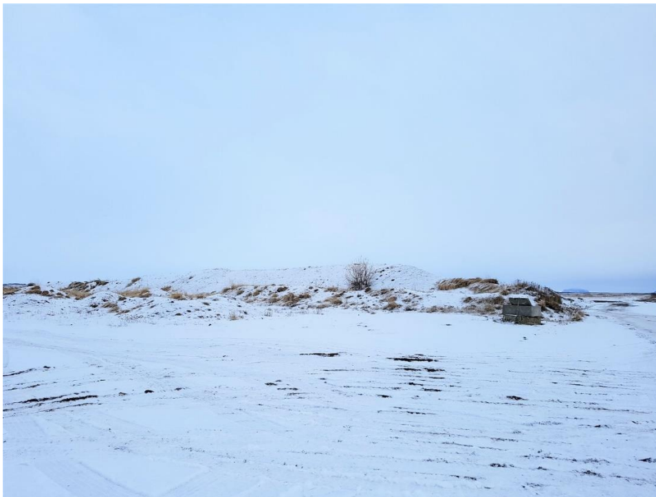
Mynd 5. Áætluð staðsetning brennsluofns.