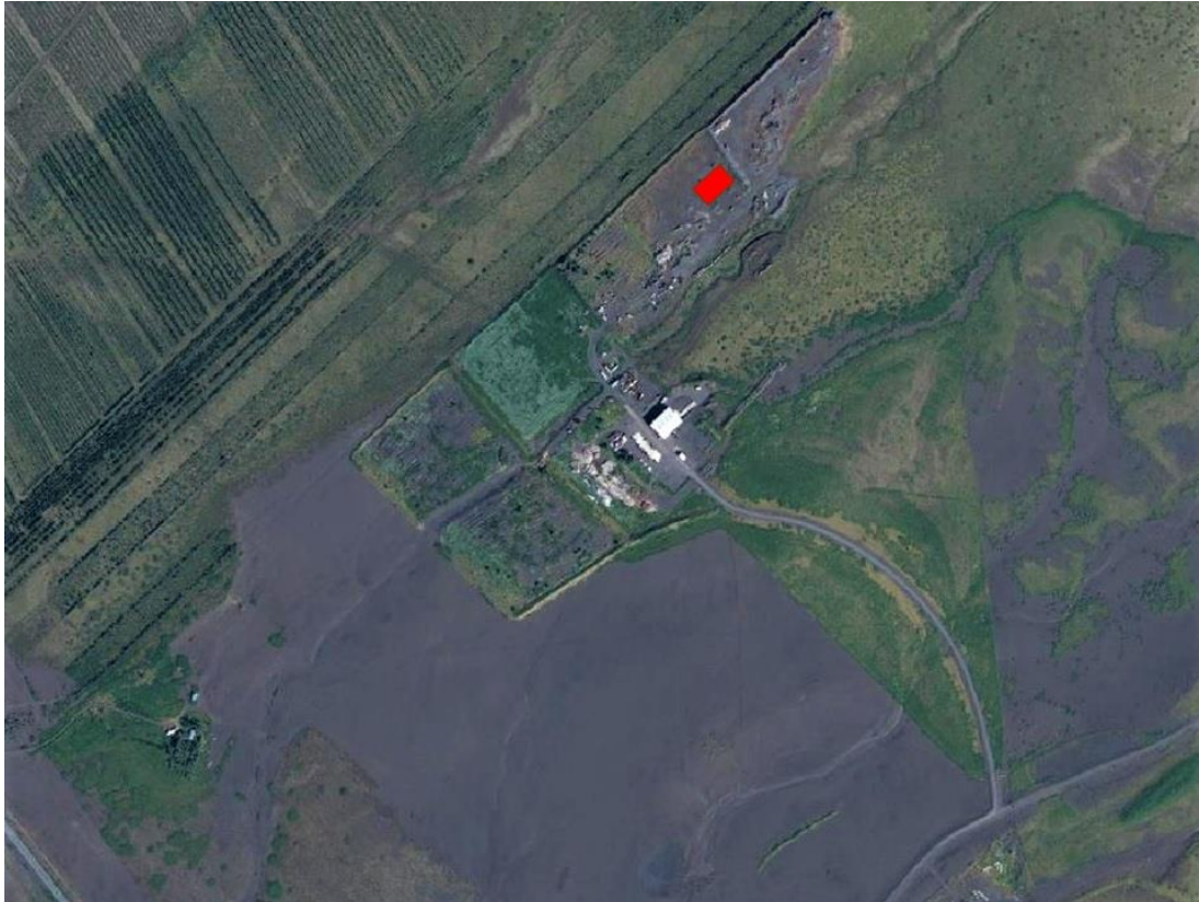
Mynd 4. Áætluð staðsetning brennsluofns (rauður reitur) innan urðunarsvæðisins á Strönd.