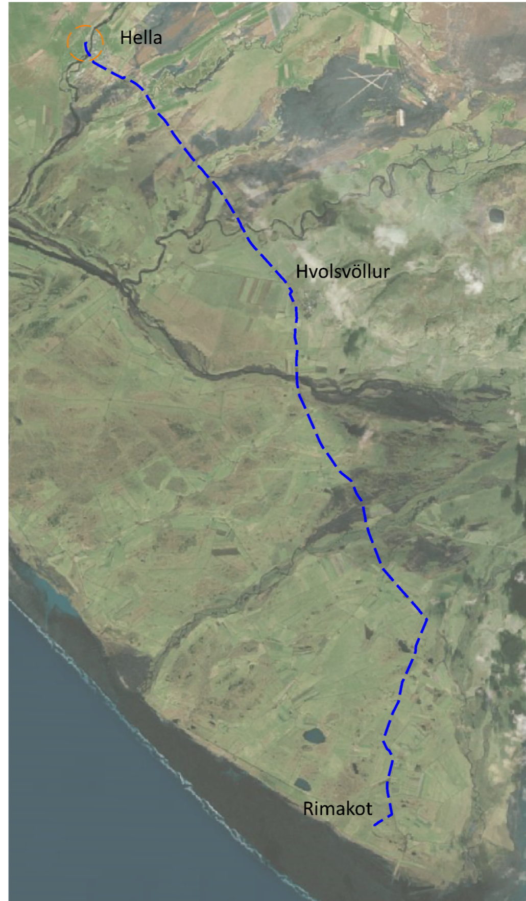
SKÝRINGARMYND, Rimakotslína - áætluð strengleið frá Hellsu að Rimakoti í Landeyjum

Skipulagsuppdra'ttur er teiknaður í kortagrunni sveitarfélagsins