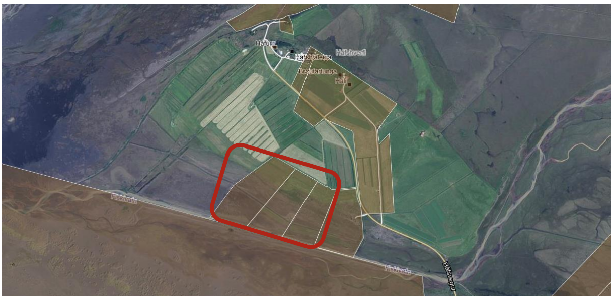
MYND 2. Háfshjáleiga land 1-3 er innan rauða kassans.

Skipulagssvæði Háfshjáleigu land 1-3 er að hluta til mólendi en grasi gróið ofar í lóðunum. Samkvæmt vistgerðarkortlagningu NÍ er svæðið skilgreint sem tún og akurlendi, mosamóavist, hrossanálavist og víðikjarrvist. Ekki er gert ráð fyrir að allt svæðið verði breytt í verslunar- og þjónustusvæði, heldur allt að 6 ha af öllum þremur lóðunum.