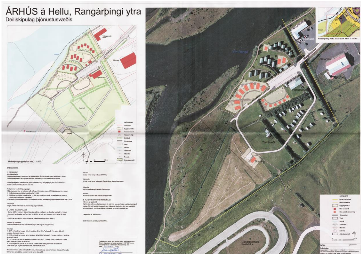
MYND 3. Gildandi deiliskipulag.

Í gildi er deiliskipulag á hluta svæðisins, Árhús á Hellu, frá árinu 2010. Skipulagið gerir ráð fyrir uppbyggingu smáhýsa, þjónustuhúsi og snyrtingu á tjaldsvæði. Skipulagið verður felmt úr gildi með nýju deiliskipulagi.