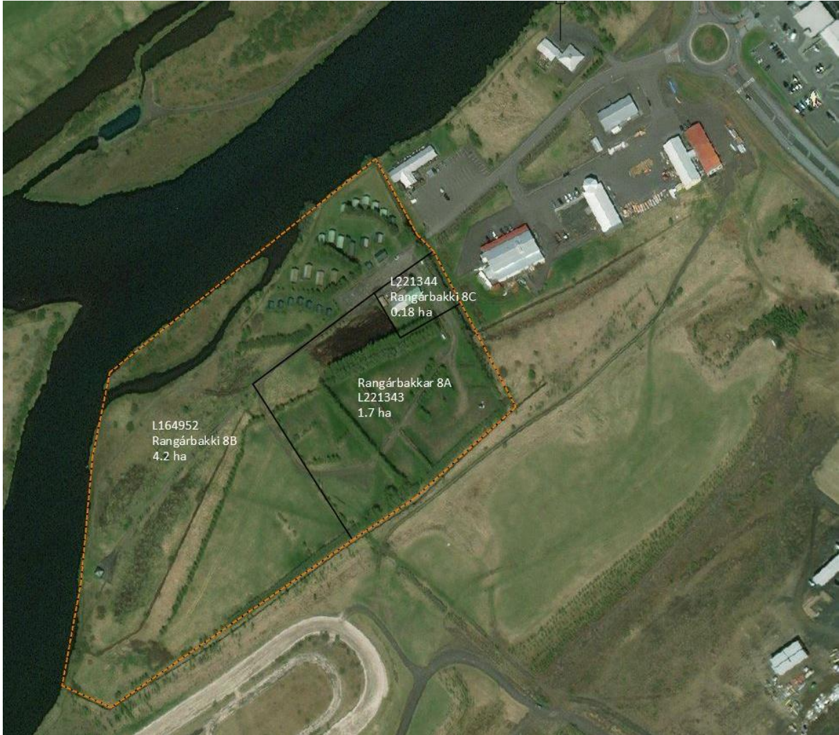
MYND 1. Yfirlitsmynd af skipulagssvæðinu.

Á lóðunum þremur er rekin ferðapjónusta í 25 smáhýsum, um 100 gistipláss, sem eru leigð út til skammtímagistingar. Einnig er tjaldsvæði Árhúsa innan lóðanna. Á svæðinu er salernis- og þvottaaðstaða. Svæðið er nánast allt þegar raskað, flatt og algróið og hefur verið reitað niður með skjólbeltum. Það er innan mikilvægs fuglasvæðis sem nær yfir allt suðurlandsundirlendið en nýtur ekki verndar að öðru leyti.