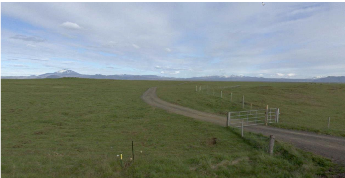
MYND 2. Horft austur yfir skipulagssvæði Efra-Sels 3c.

Austursel (landnr. 220359), var áður hluti Efra-Sels 3C, er um 17 km norðan Hellu með aðkomu frá Bjallavegi. Efra-Sel er skilgreint sem frístundasvæði í aðalskipulagi en verður breytt í landbúnaðarsvæði. Heimiluð verður bygging íbúðarhúss og almenn uppbyggingu á lóðinni í samræmi við aðalskipulag. Svæðið er skráð 3,9 hektarar að stærð. Landið er grasi gróið og fremur flatt. Engar skráðar náttúruminjar eru á svæðinu. Svæðið nýtur ekki sérstakrar verndar svo sem hverfisverndar. Í vistgerðarkortlagningunni NÍ er að finna língresis- og vingulvist og víðikjarrvist á svæðinu.