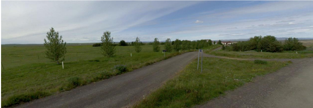
MYND 3. Horft norður yfir skipulagssvæði Heiðar.

Heiði (landnr. 164645) Rangárvöllum, er um 15 km austan Hellu með aðkomu um aðkomuveg frá Þingskálavegi. Heiði er skilgreind sem landbúnaðarland í aðalskipulagi en verður breytt í íbúðarsvæði. Svæðið er skráð 1,9 ha að stærð. Landið er grasi gróið og trjám hefur verið plantað á svæðinu. Í vistgerðarkortlagningunni er að finna tún og akurlendi, língresis- og vingulsvist, víðimóavist, flagmóavist. Svæðið nýtur ekki sérstakrar verndar svo sem hverfisverndar. Engar skráðar náttúruminjar eru á svæðinu. Fyrirhugað er að skipta svæðinu upp í 5 lóðir og hver lóð verður 2500 – 5000 m 2 að stærð. Á lóðinni er fyrir eitt sumarhús og geymslubygging.