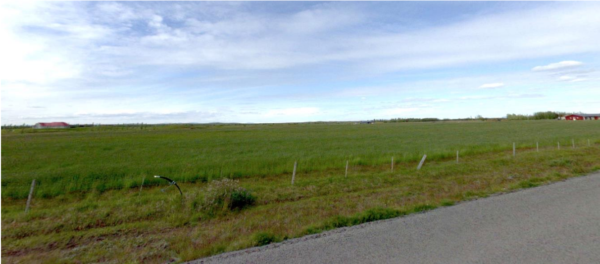
MYND 1. Horft norður yfir skipulagssvæði Árbæjarhellis 2.