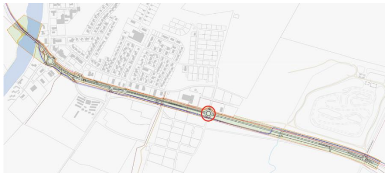
MYND 10 Nýtt hringtorg við Dynskál og Sleipnisflátir.