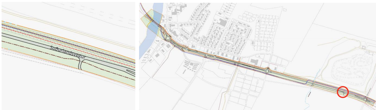
MYND 11 Núverandi tenging fyrir Gaddstaði, afleggjari inn á Þjóðveg 1 verður víkjandi í skipulaginu.