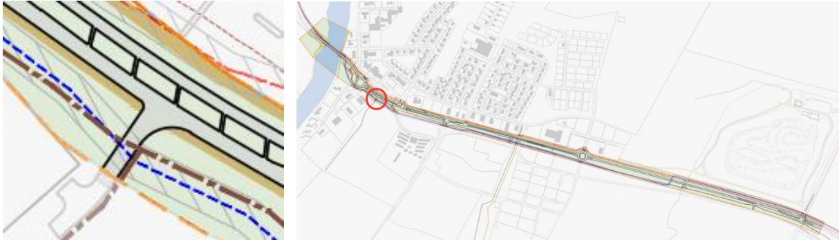
MYND 5 Bætt er við útkeyrslu til hægri frá atvinnusvæði Rangárbakka.

Í dag er engin tenging við þjóðveginn frá Rangárbakka. Bætt er við útkeyrslu til hægri (austurs) inn á þjóðveginn, frá svæðinu.