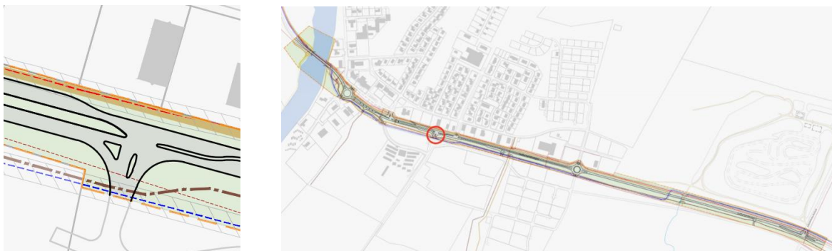
MYND 7 Gaddstaðavegur, gatnamótin haldast óbreytt í skipulaginu.

Í dag eru gatnamótin T-gatnamót og forgangsstýrð með aðskilnaði milli akstursstefna. Gatnamótin haldast óbreytt í skipulaginu.