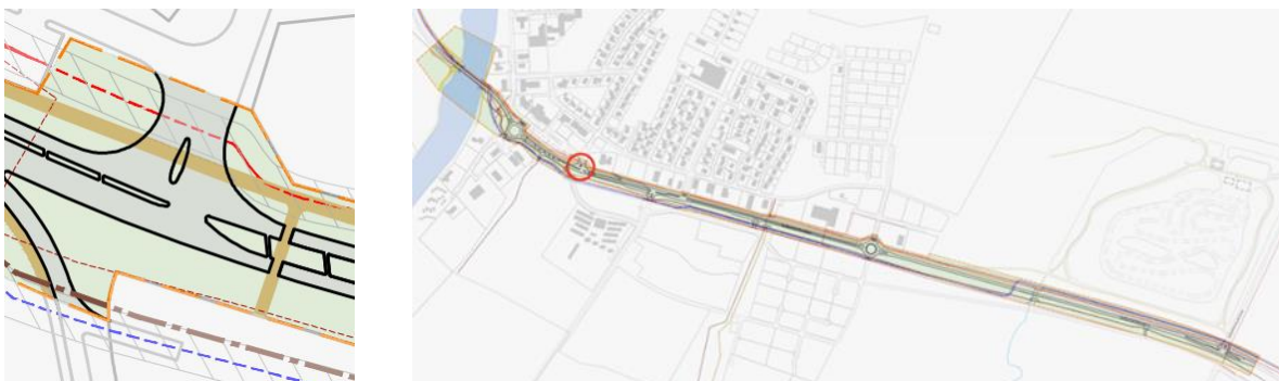
MYND 6 Freyvangur, gert er ráð fyrir minniháttu breytingum við gatnamótin til að bæta umferðaröryggi gatnamótanna.

Aðkoma að Rangárflötum (Stracta-hóтели) frá þjóðveginum verður óbreytt í skipulaginu.