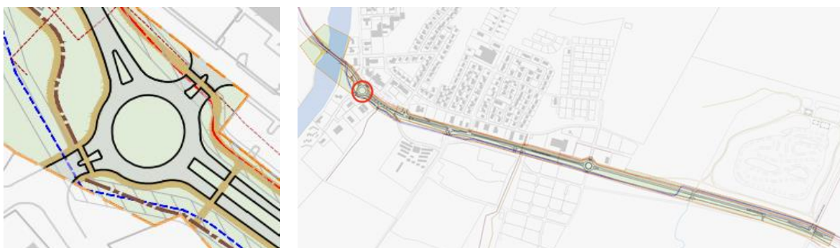
MYND 4 Hringtorgið við Rangárbakka.

Í dag er hringtorg á gatnamótunum. Gatnamótin haldast óbreytt fyrir akandi vegfarendur. Í skipulaginu er gert ráð fyrir að bæta aðgengi gangandi og hjólandi vegfarenda um gatnamótin, með bættum innviðum. Sameiginlegur stígur er sunnan og norðan við hringtorgið sem liggja að gatnamótunum. Gönguþveranir verða merktar sem gangbrautir og verða í plani til að auðvelda aðgengi hjólandi vegfarenda. Við gönguþveranir verður bætt lýsing til að auka umferðaröryggi virkra vegfarenda.