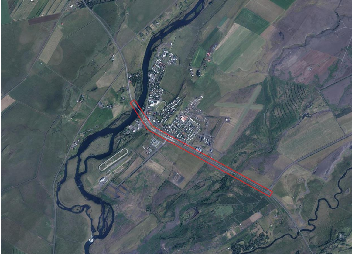
MYND 1 Skipulagssvæðið er innan rauða rammans.

Skipulagið kallar á minniháttar breytingu skipulagsmarka á aðliggjandi deiliskipulögum.