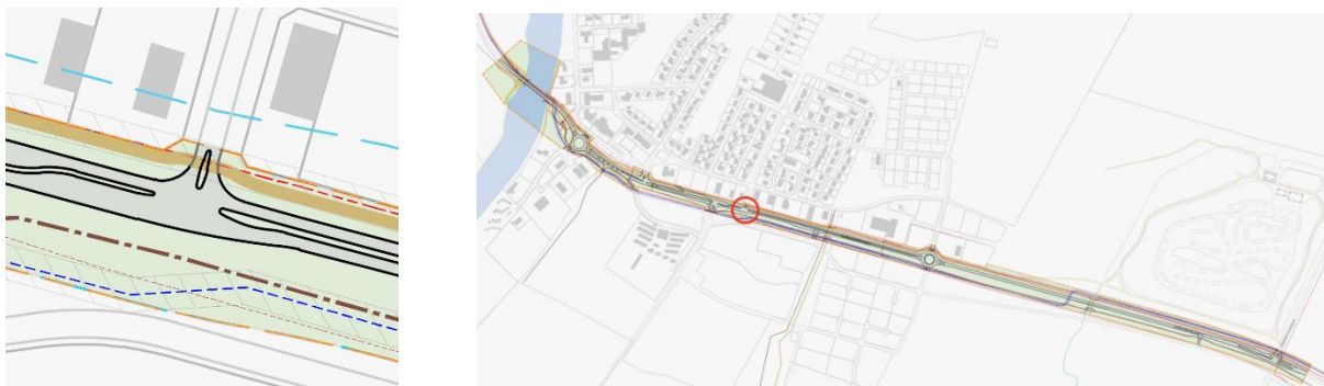
MYND 8 Langisandur, gert er ráð fyrir minniháttu breytingum við gatnamótin til að bæta umferðaröryggi gatnamótanna.

Í dag eru gatnamótin T-gatnamót og forgangsstýrð án aðskilnaðar milli akstursstefna. Leyfðar eru vinstri beygjur að og frá Langasandi frá þjóðveginum í dag. Til þess að auka umferðaröryggi gatnamótanna, er bætt við miðeyju milli akstursstefna á Langasandi. Sameiginlegur stígur er norðan við gatnamótin og göngubverun í plani yfir Langasand. Við göngubverun verður bætt lýsing til að auka umferðaröryggi virkra vegfarenda.