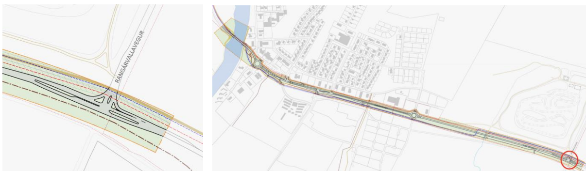
MYND 12 Rangárvallavegur, gert er ráð fyrir breytingum við gatnamótin til að bæta umferðaröryggi gatnamótanna.

Í dag eru gatnamótin T-gatnamót, með aðskilnaði milli akstursstefna á Rangárvallavegi og hjárein á Þjóðveginum. Gatnamót eru á blindhæð, þar sem er mjög skert sýn til austurs, þegar komið er af Rangárvallavegi. Gert verður áfram ráð fyrir T-gatnamótum, en horft er til framtíðar með að auka umferðaröryggi gatnamótanna og aðgreina akstursstefnur á Þjóðveginum með miðeyju / yfirborðsmerkingum, til að sporna gegn því að tekið sé fram úr á gatnamótunum.