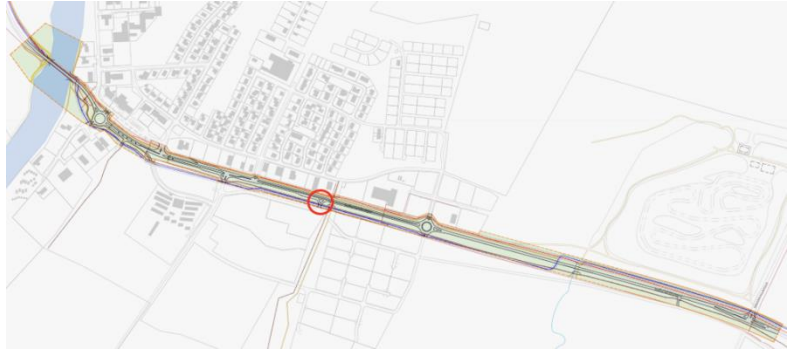
MYND 9 T-gatnamót við Faxaflátir, aðeins hægri inn og hægri út.