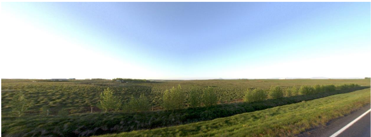
MYND 1. Horft norðaustur yfir skipulagssvæði Þjóðólfshaga 1.

Þjóðólfshagi 1 (landnr. 165164) er um 10,4 km vestan Hellu og með aðkomu frá Suðurlandsvegi. Þjóðólfshagi 1 er í heildina skráð 100,8 ha að stærð. Skipulagssvæðið verður breytt úr frístundabyggð yfir í íbúðarbyggð. Skipulagssvæðið er um 40 ha að stærð og er tiltölulega flatt en hallar lítillega til suðausturs. Búið er að byggja á 23 lóðum en í gildandi deiliskipulagi er gert ráð fyrir allt að 33 frístundalóðum.