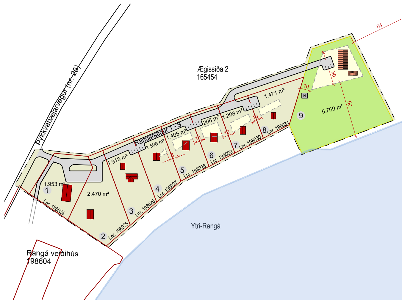
Breytt skipulag 1:2000