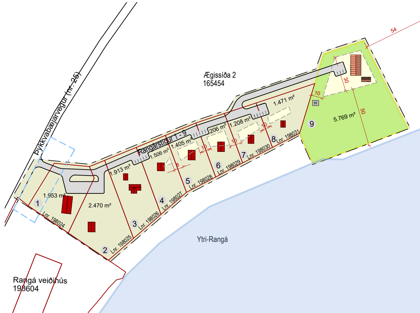
Upprunalegt deiliskipulag án breytinga - staðfest í B. deild 27.11.2017. 1:2000