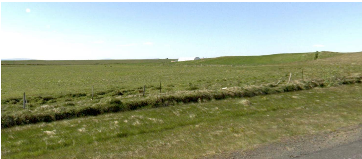
MYND 1. Horft norðvestur yfir að skipulagssvæði Stakkatúns af Þykkvabæjarvegi.

Stefnt er að því að efla ferðapjónustu í sveitarfélaginu og auka framboð á gistirýmum en mikil eftirspurn er á hverju ári eftir gistingu samfara því að ferðamönnum fjölgar. Ægissíða er staðsett við bakka Ytri-Rangár, um 2,5 km vestan við Hellu. Aðkoma að skipulagssvæðinu er af Þykkvabæjarvegi nr. 25. Skipulagssvæðið er grasi gróið og samkvæmt vistgerðarkortlagningu NÍ (Náttúrufræðistofnun Íslands) er að finna tún og akurlendi á svæðinu.