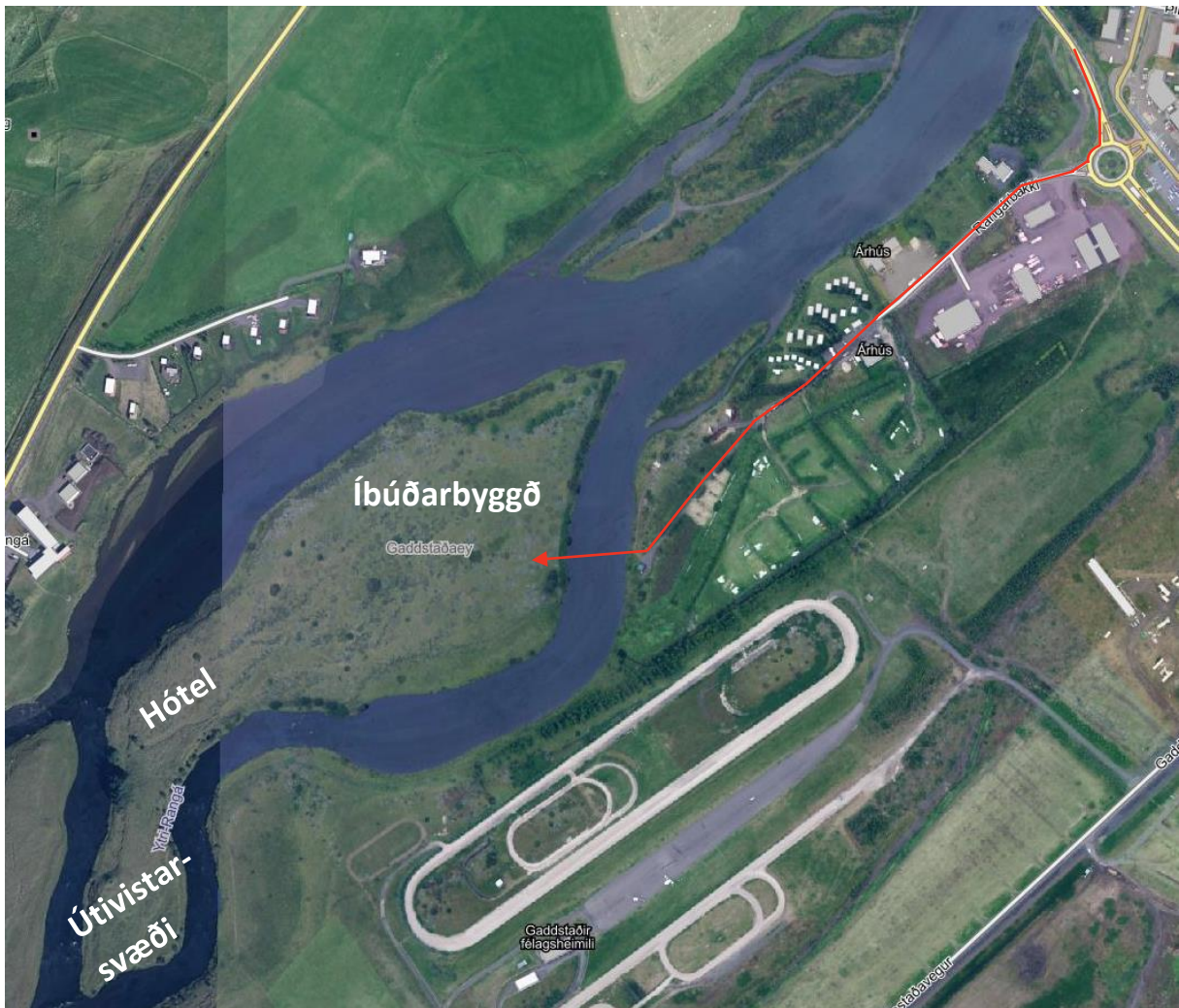
MYND 1. Aðkoma að skipulagssvæðinu merkt með rauðri ör.