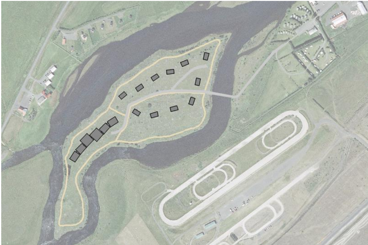
MYND 3. Tillaga að mögulegu skipulagi mannvirkja á eyjunni.

Áætlað er að íbúðalóðir verða um 0,2 – 0,65 ha að stærð en hótellóð allt að 3 ha. Nánar verður gerð grein fyrir breytingunum í greinargerð aðalskipulagsbreytingarinnar.