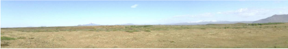
MYND 1. Horft yfir skipulagssvæðið úr norðaustri.

Í vistgerðarkortlagningu NÍ er að finna tún og akurlendi, víðikjarrvist og hraungambravist. Einnig er svæðið innan skilgreinds VOT-S 3 Suðurlandsundirlendi - mikilvægt fuglaverndunarsvæði. Svæðið nýtur ekki sérstakrar verndar svo sem hverfisverndar.