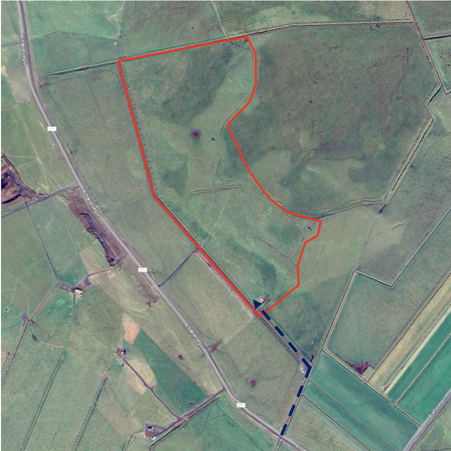
MYND 1. Skipulagssvæðið er innan rauða flákans. Aðkoman er blámerkt með brotalínunum.