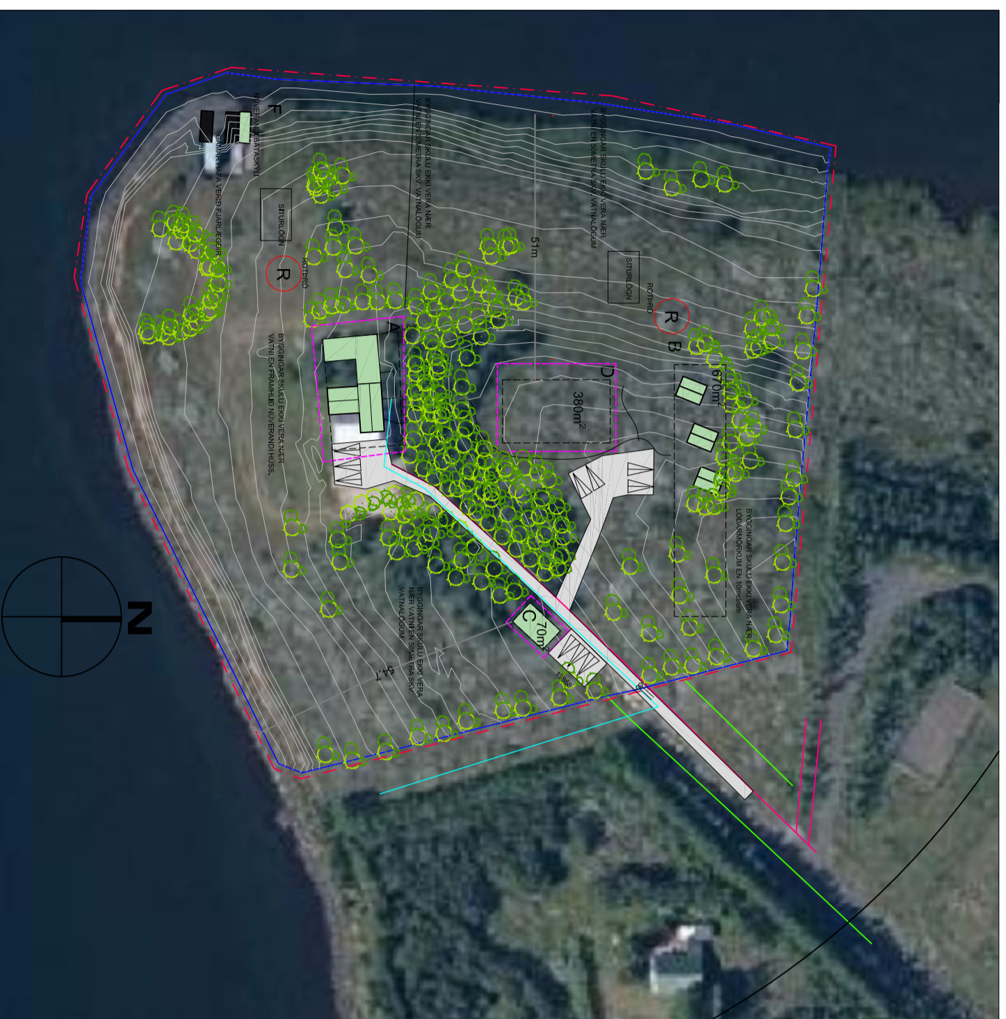
Skipulagssvæði 1 ha. Hagi land 1:1000