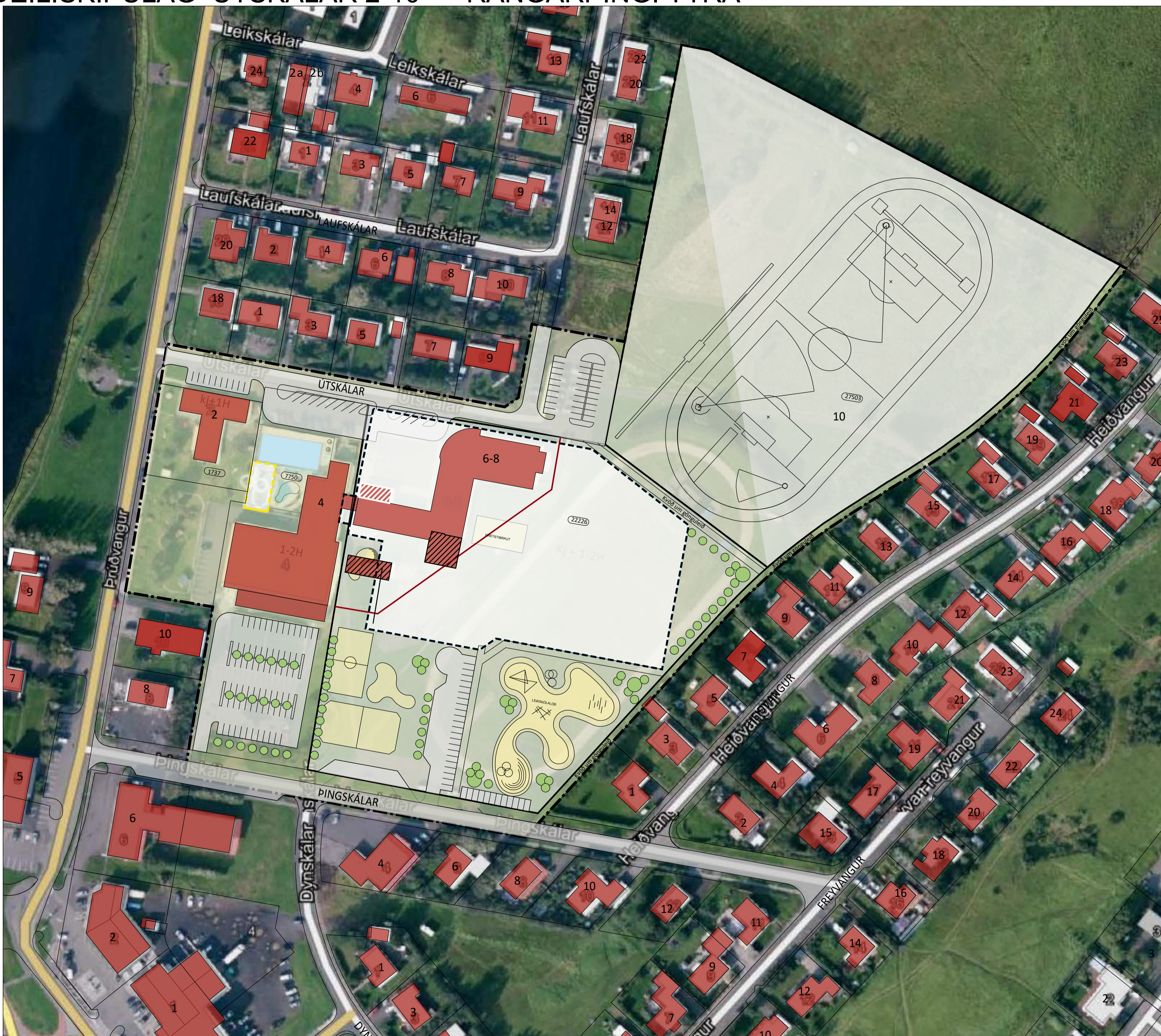
Deiliskipulagstillaga mkv. 1:1000

Tillagan var auglýst frá _____ 20__ með athugasemdafresti til _____ 20__. Auglýsing um gildistöku deiliskipulagsins var birt í B-deild Stjórnartíðinda þann _____ 20__.