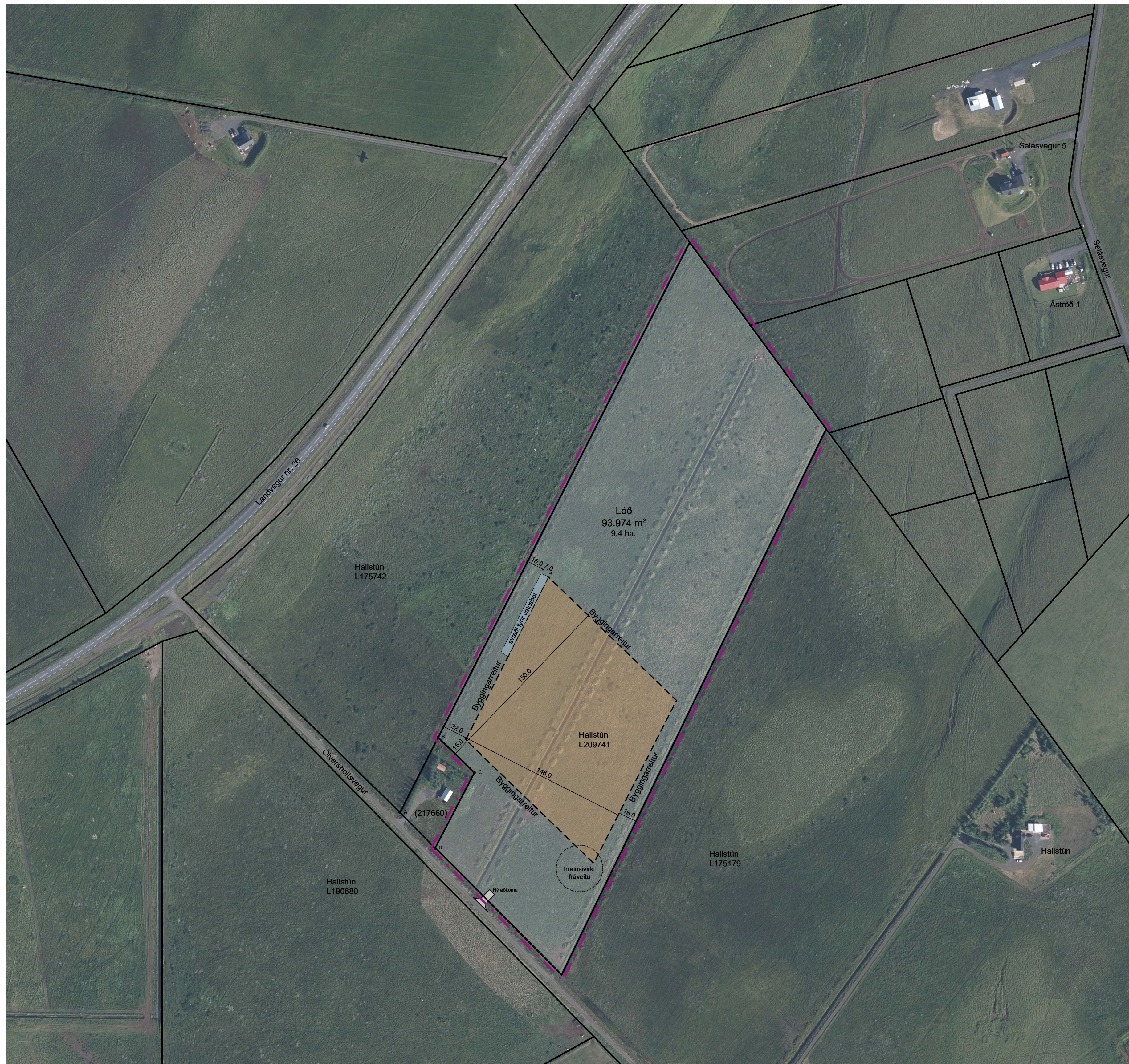
Deiliskipulagstillaga, mkv. 1:2000