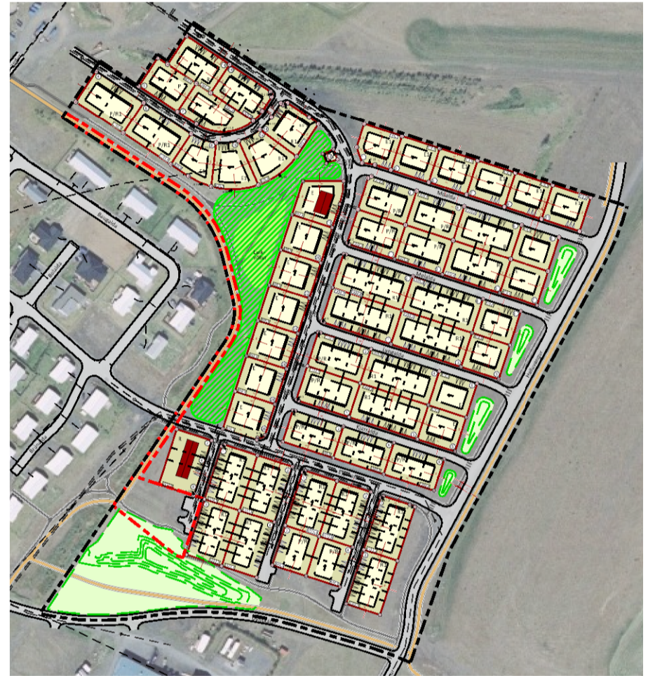
GILDANDI DEILISKIPULAGSUPPDRÁTTUR, MINNKADUR Í 1:4.000