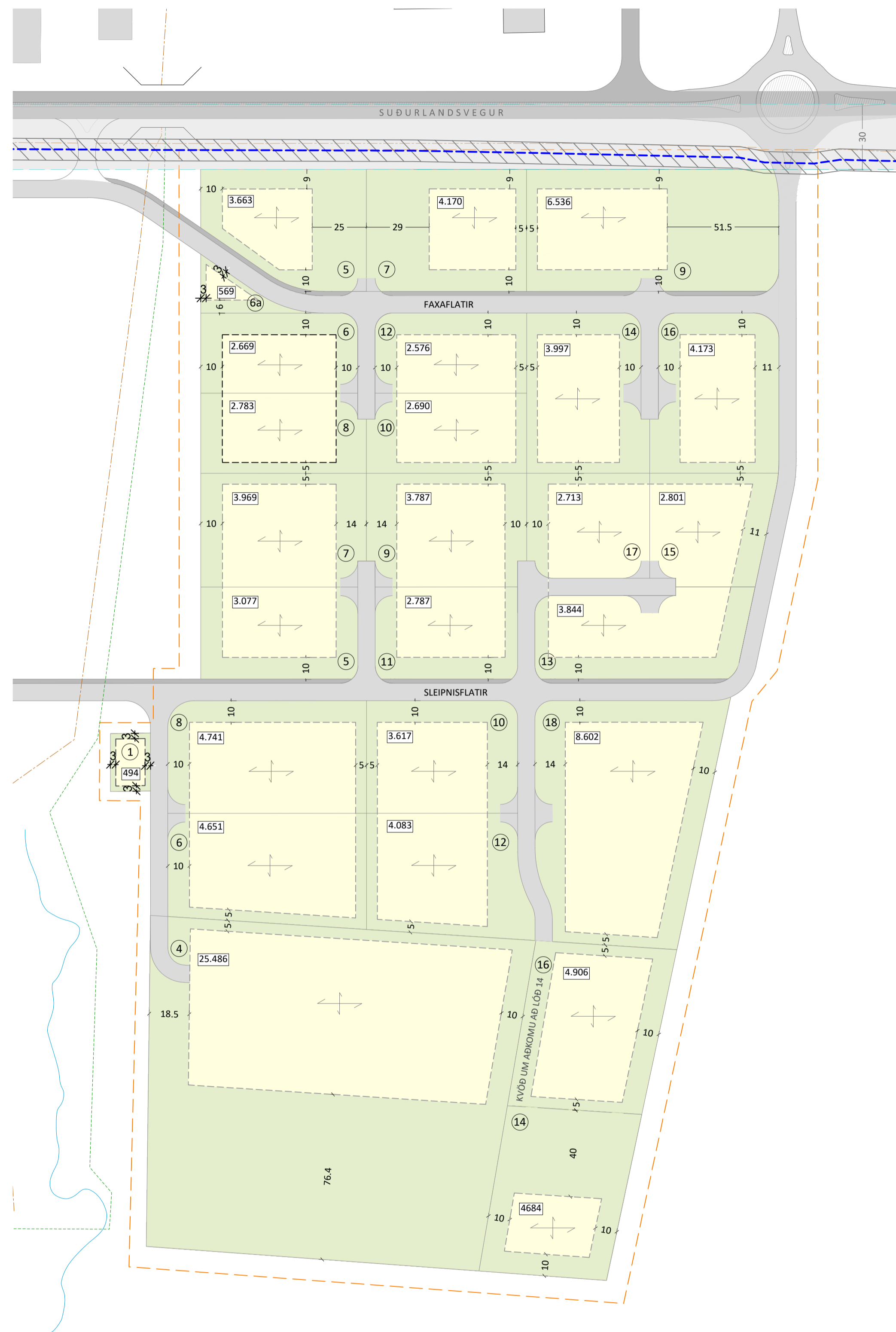
DEILISKIPULAGSUPPDRATTUR EFTIR BREYTINGU 1:1.500

Breytt er texta; Svæði fyrir verslunar- og þjónustustarfsemi er við Faxaflátir, allt að 10 lóðir, þar af ein lóð fyrir spennistöð. Kvæðir