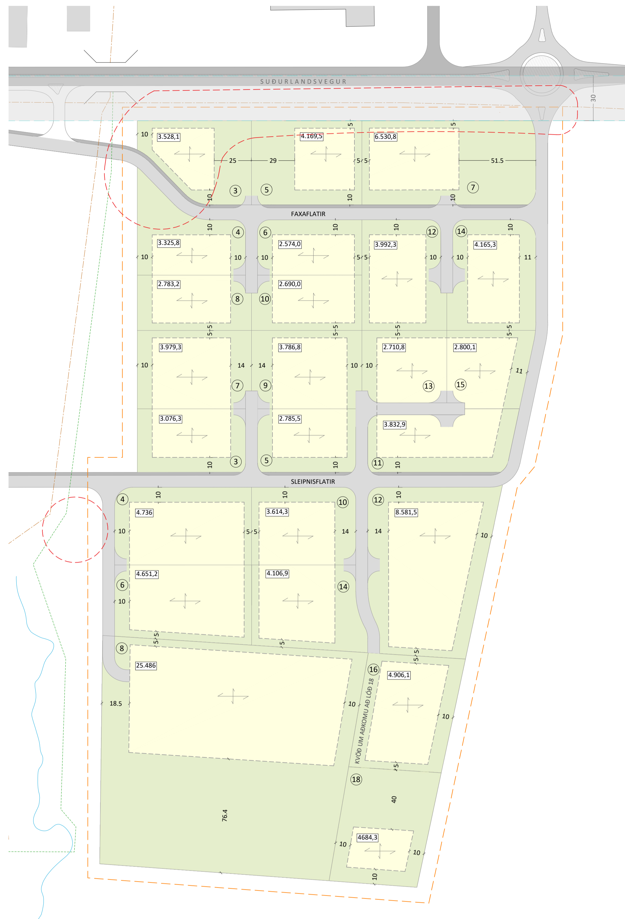
DEILISKIPULAGSUPPDRATTUR FYRIR BREYTINGU 1:1.500