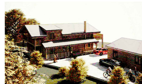
Möguleg ásynnd. Unnið af Arkþingi.

Deiliskipulag þetta fellur ekki undir Lög um umhverfismat framkvæmda og áætlana nr. 111/2021, þar sem ekki er mörkuð stefna um nýjar framkvæmdir er varðar leyfisveitingar til framkvæmda sem þar eru tilgreindar. Stefna deiliskipulagsins fellur vel að skilmálum í aðalskipulagi og landsskipulagsstefnu. Staðsetning mannvirkja er í góðum tengslum við núverandi vegi og veitur. Áhrif af uppbyggingunni eru talin hafa jákvæð áhrif á samfélagið þar sem er verið að fjölga notendum veitukerfa sem fyrir eru og halda þarf rekstri í dreifðum byggðum. Bætt nýting núverandi kerfa styður einnig við umhverfissjónarmið og hagkvæma þróun byggðar.