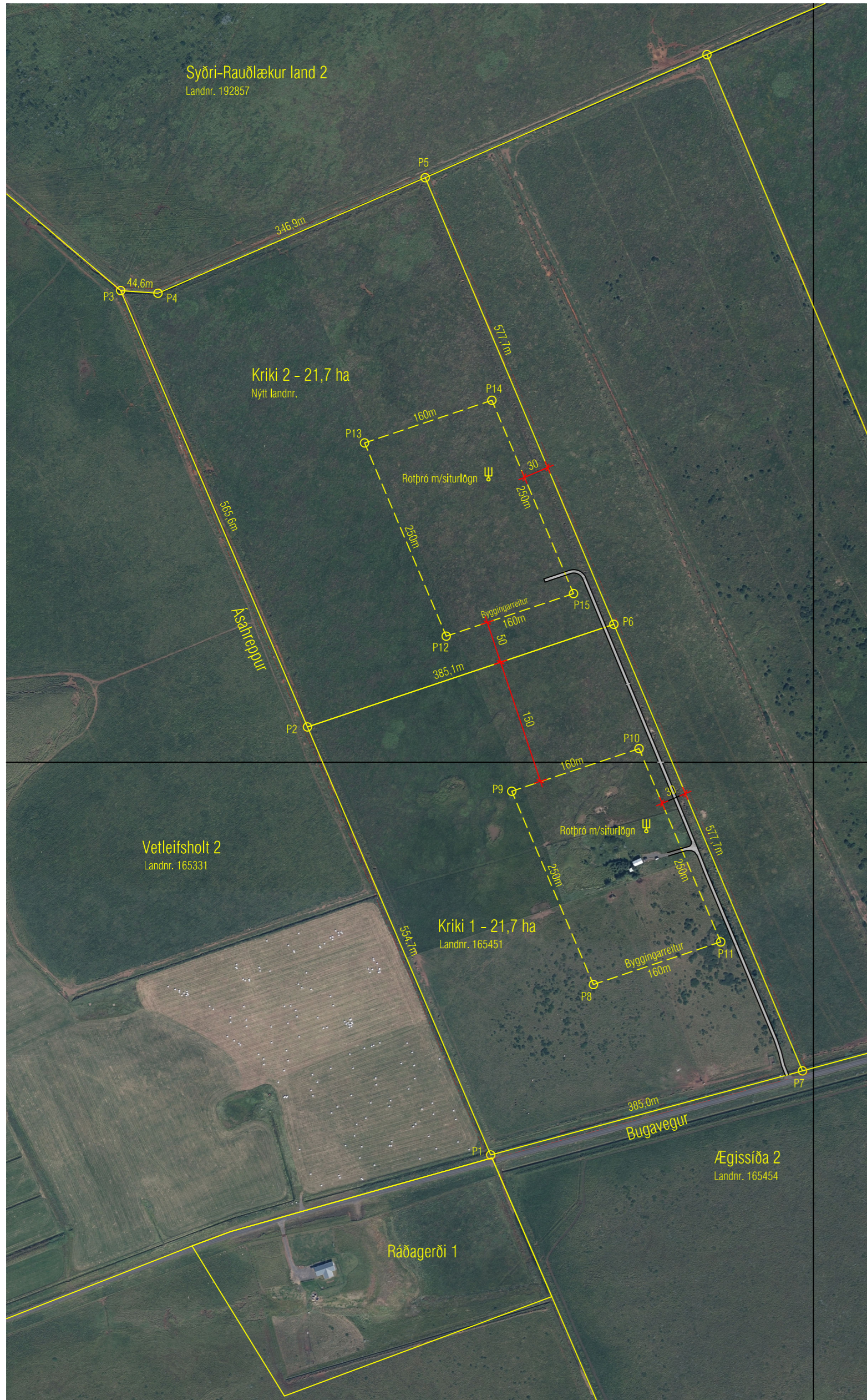
Tillaga að deiliskipulagi - Mkv. 1:5000