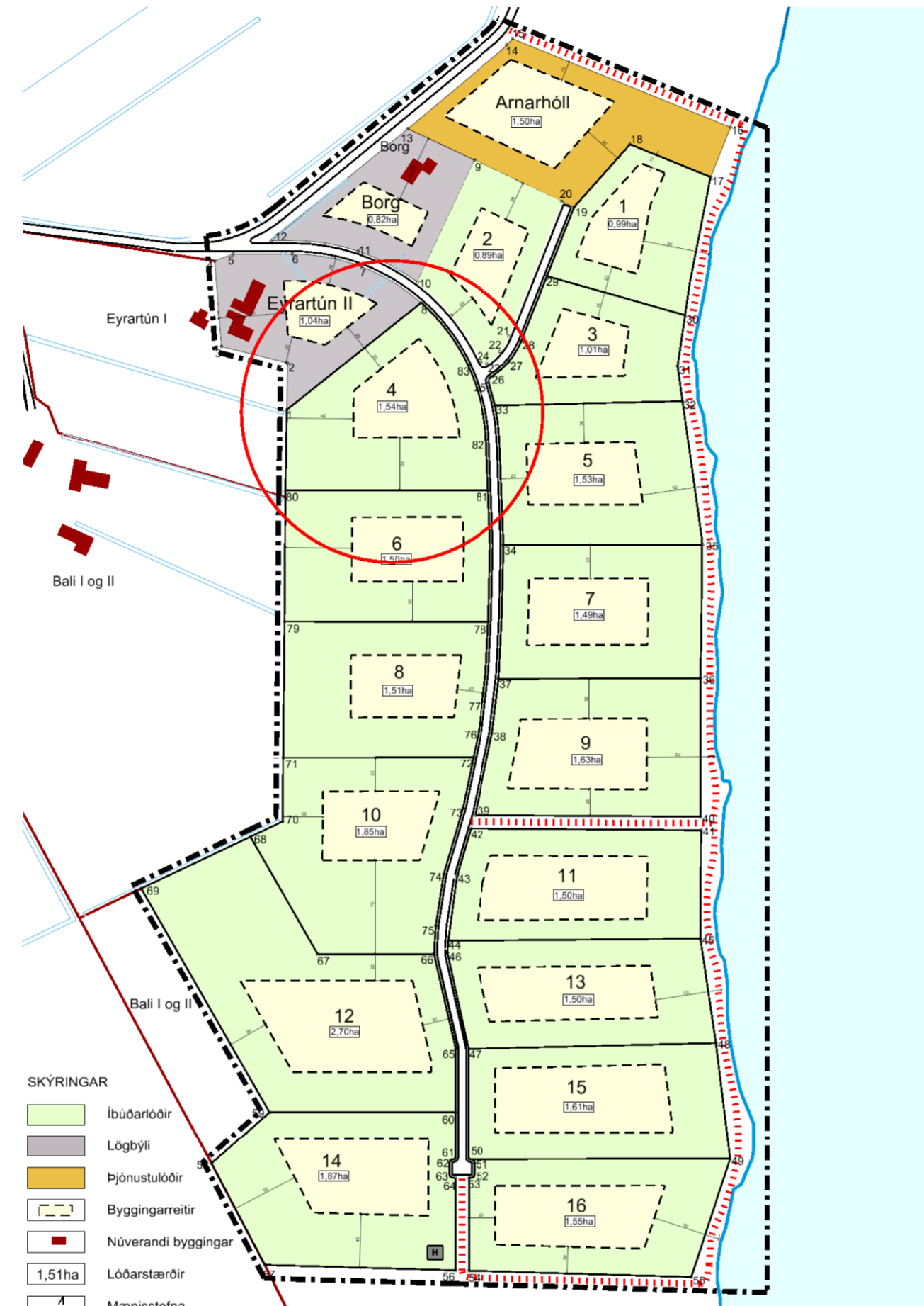
Gildandi deiliskipulagsuppráttur, minnkaður í 1:4.000