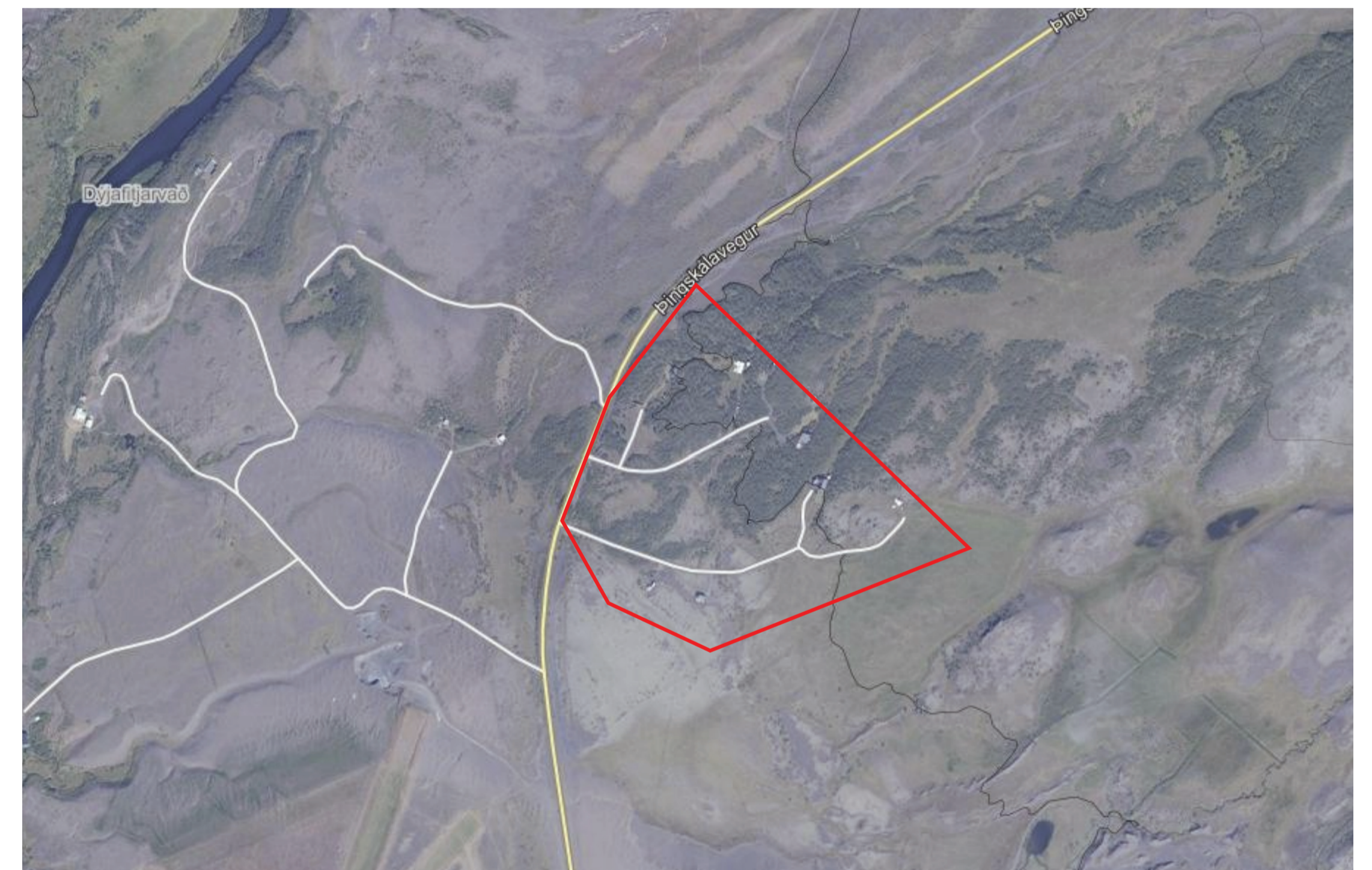
Skýringaruppráttur mkv. 1:7000