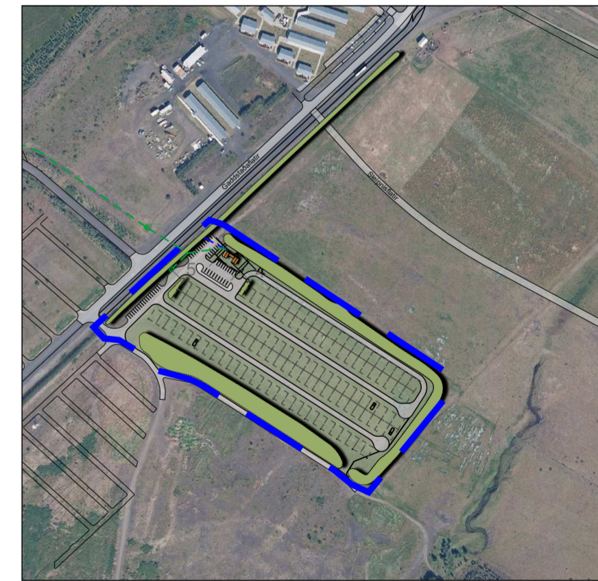
Skýringamynd, mkv. 1:5.000