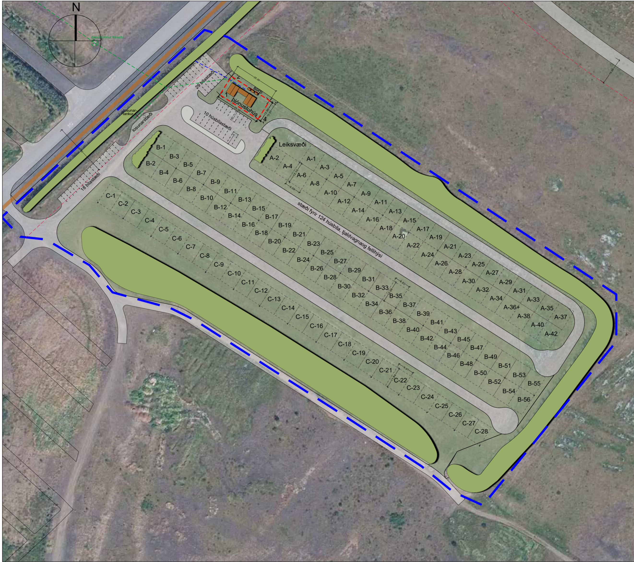
Deiliskipulag í mkv. 1:1000

Heimilt er að gróðursetja trjá- og runnagróður innan svæðisins til skjóls- og rýmismyndunar. Yfirbragð gróðurs skal vera í samræmi við náttúrulegt birkiþjarr sem víða finnst innan sveitarinnar þ.e. birkir, reyfir og lágvaxinn víðir í óreglulegum þyrpingum. Jarðraski skal halda í lágmarki við útfærslu deiliskipulags. Það jarðrask sem er óhjákvæmilegt skal lagfært jafnóðum og gróður færður í fyrra horf.