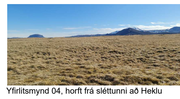
Yfirlitsmynd 04, horft frá sléttunni að Heklu