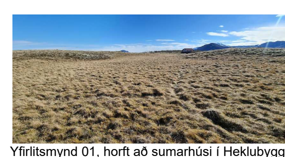
Yfirlitsmynd 01, horft að sumarhúsi í Heklubýggð