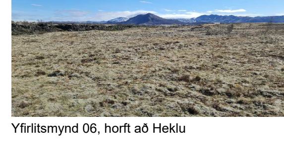
Yfirlitsmynd 06, horft að Heklu