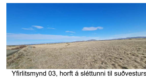
Yfirlitsmynd 03, horft á sléttunni til suðvesturs