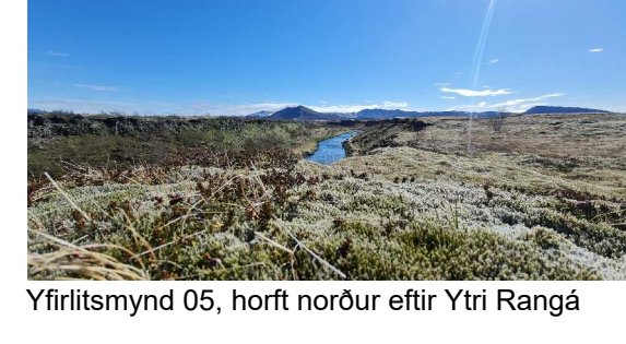
Yfirlitsmynd 05, horft norður eftir Ytri Rangá