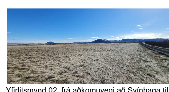
Yfirlitsmynd 02, frá aðkomuvegi að Svínhaga til norðurs