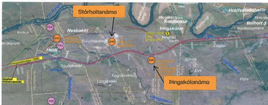
Mynd 1. Fyrirhuguð uppbygging Pingskálavegar og námur.